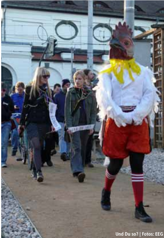
Und Du so?