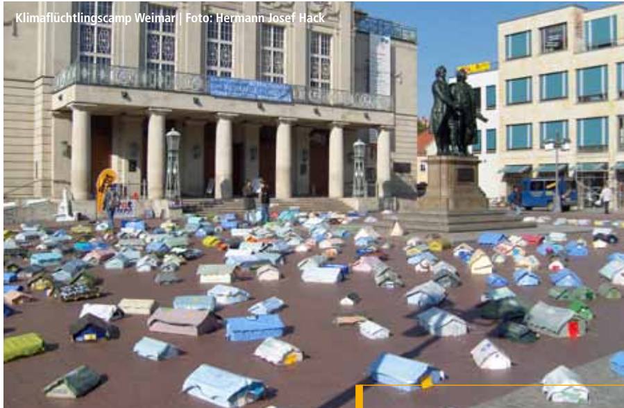
Klimaflüchtlingscamp Weimar

KünstlerInnen heute sind oft Allrounder. Mit Kunstaktionen reisen sie um die ganze Welt oder bespielen kontinuierlich Orte mit vielen Beteiligten. Sie sind Experten für Konzept und Design, Management und Marketing, für strategische Planung und Krisenbewältigung. Sie sind Sozialarbeiter und Pädagoge, Chef und Hilfsarbeiter. Wir fragen zwei nach den Hintergründen ihres Tuns.